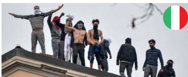
Fångar protesterar mot karantänregler, Milano.