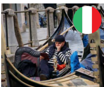
Gondoljör utan kunder, Venedig.