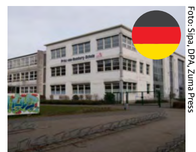
Utrymd skola, Neustadt.