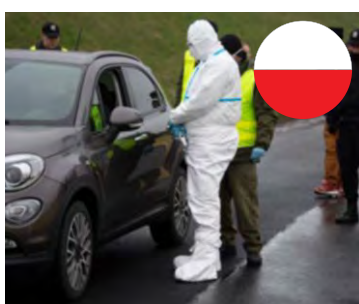
Bilist virustestas, Jedzzychowice.