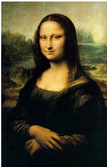
Mona Lisa, Leonardo Da Vinci 1503

En parafras är en omtolkning av en speciell bild eller en konstnärs typiska uttryckssätt. Det finns många sätt att tolka om en bild. Det kan vara bara på skoj eller en vilja om att sprida ett budskap. Ett sätt är att måla in ett annat ansikte i ett känt porträtt t.ex. Mona Lisa .