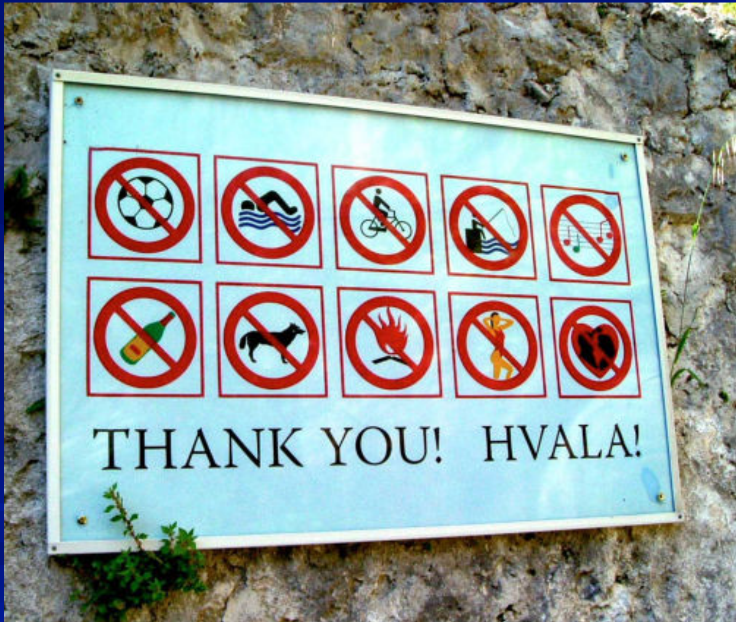
Strand i Bosnien