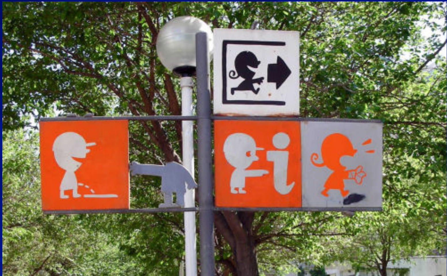
En park i Spanien