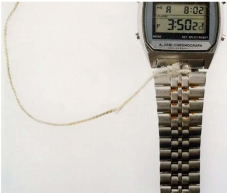
Mannens armbandsur har siffrorna 553978 ingraverat på baksidan, ett serienummer som såldes i Sverige. Snöret skulle rädda klockan om armbandet skulle gå av.