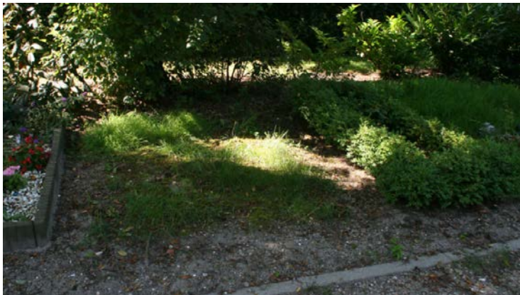
I den här anonyma graven har mannen lagts till sin sista vila.

Mannen lades till sin sista vila i augusti 1995, i en gravplats efter en borgerlig begravning i Den Helder nära Razende Bol. Den som tror sig veta vem han var eller har tips om hur den nederländska polisen ska kunna få en träff kan vända sig till mejladressen missingpersons@nautiem.nl eller ringa på +31793459876.