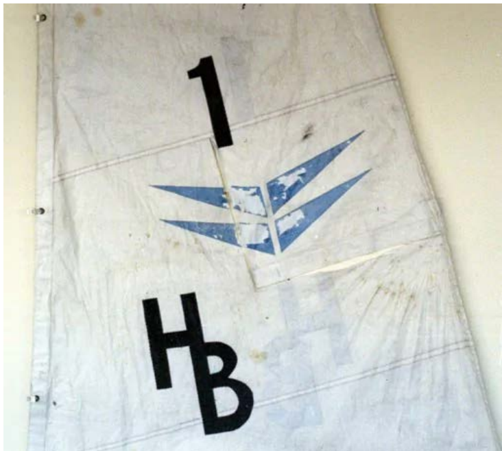
Siffran och bokstäverna hör inte till originalseglet utan har satts dit, kanske av den drunknade mannen.

Drygt två veckor tidigare hade vad som troligen var hans stormskadade båt hittats och senare såväl dess mast som segel. Det var en strandvakt som varskodde polisen om vraket, men det finns skäl att tro att strandletare hittat det tidigare. Båten saknade nationsflagga och utombordsmotorn var borta, sånär som en skyddskåpa av märket Yamaha.