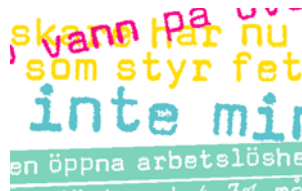
INLEDNING Sidan 3 | Gå dit >