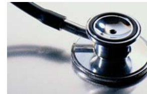
INTERVJUER Sidan 17 | Gå dit >