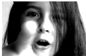
RUBRIKER Sidan 19 | Gå dit >