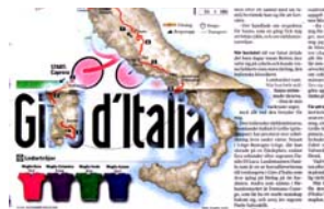
GRAFIK Sidan 18 | Gå dit >