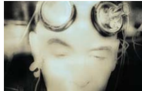
PERSONPORTRÄTT Sidan 16 | Gå dit >