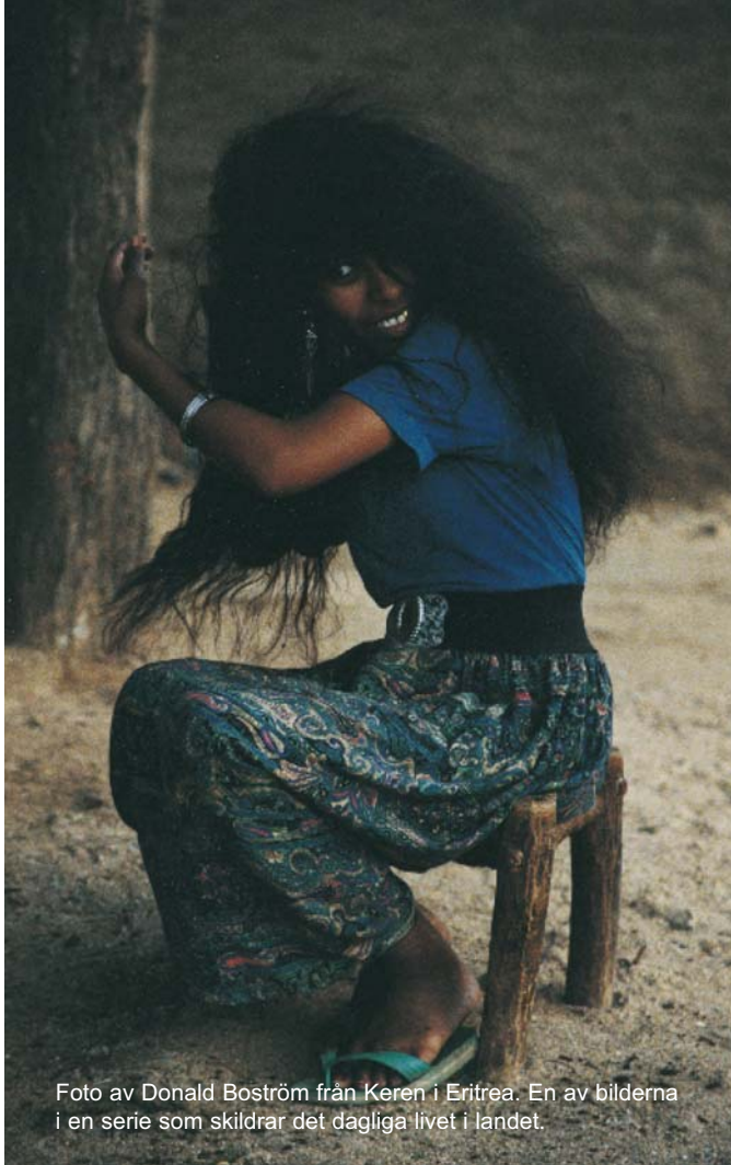
från Keren i Eritrea. En av bilderna i en serie som skildrar det dagliga livet i landet.