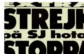
LÖPSEDEL, MELLANRUBRIKER, BILDTEXTER, PUFFAR Sidan 21 | Gå dit >

Så här använder du detta material. Längst ner på varje sida finns två pilar åt olika håll. Om du klickar på den högra hoppar du framåt en sida, om du klickar på den vänstra hoppar du bakåt en sida.