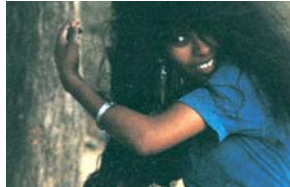
REPORTAGE Sidan 5 | Gå dit >